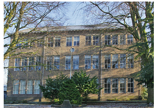
Scholieren krijgen tijdelijk les in de voormalige ambachtsschool

in de periode van sloop en verbouw van hun eigen locatie.